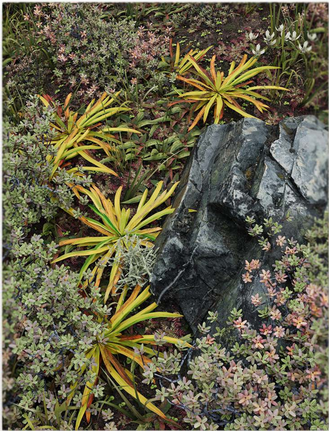
无题（遇到野猪之前）3 2024 铝、石膏打底、UV 打印 170×130×3.5cm