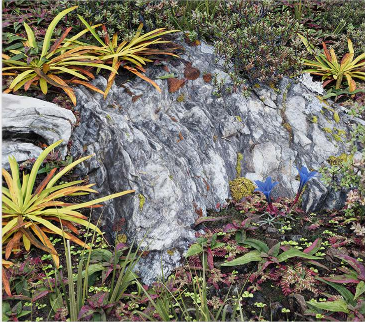
无题（过河） 2024 铝、石膏打底、UV 打印 115×130×3.5cm