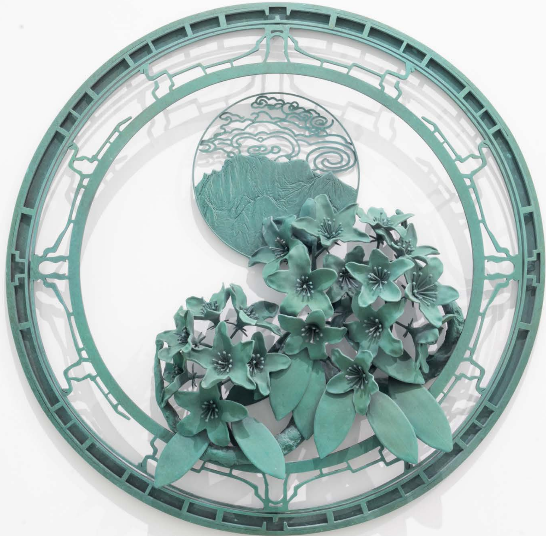
仙乃日 2024 铜 直径 60cm