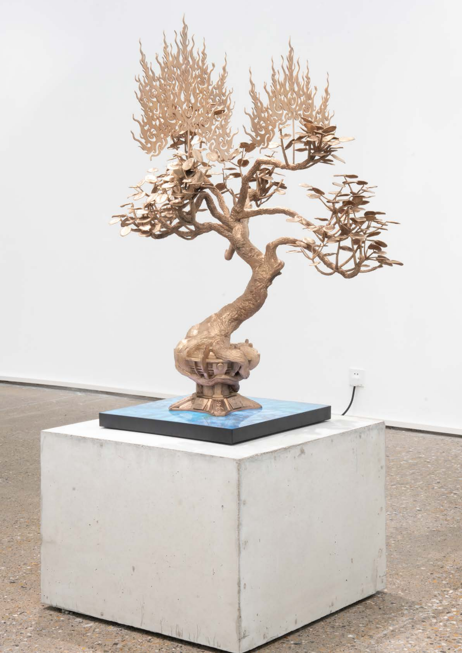
以燃烧重塑之树 2024 铜、LED 屏幕 120×89×74cm 雕塑和 LED 屏幕 50×72×72cm 水泥底座