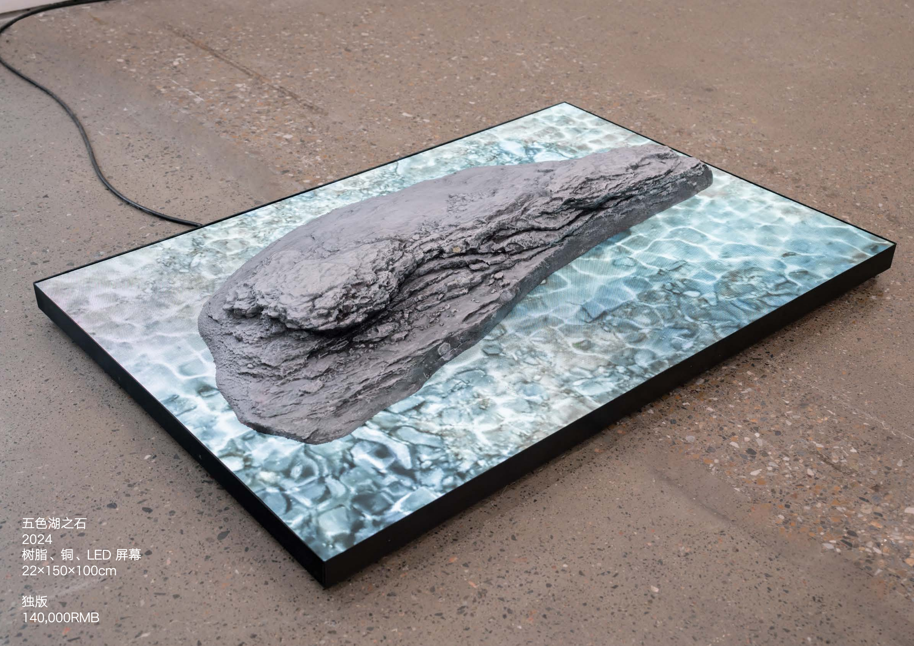
五色湖之石 2024 树脂、铜、LED 屏幕 22×150×100cm