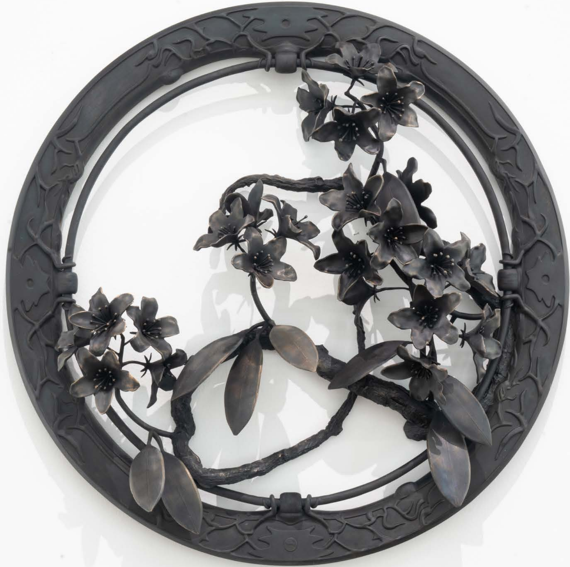
漫步去朗措 2024 铜 直径 60cm