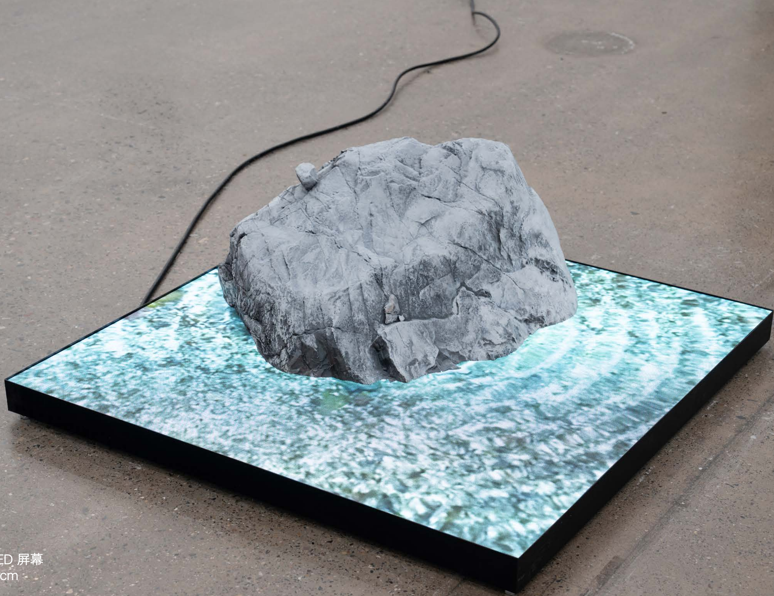
牛奶海之石 2024 树脂、铜、LED 屏幕 35×100×100cm