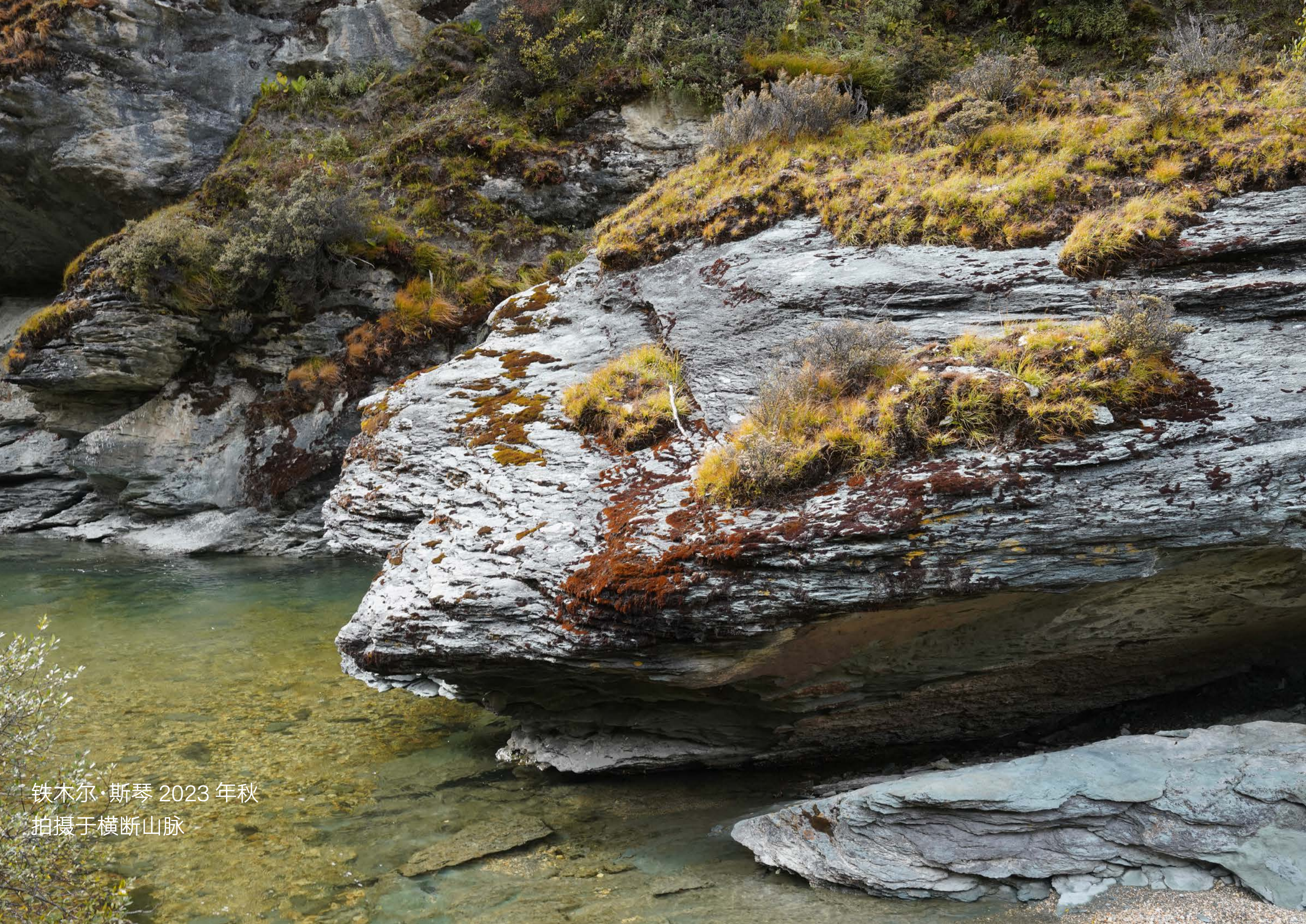
铁木尔·斯琴 2023 年秋 拍摄于横断山脉