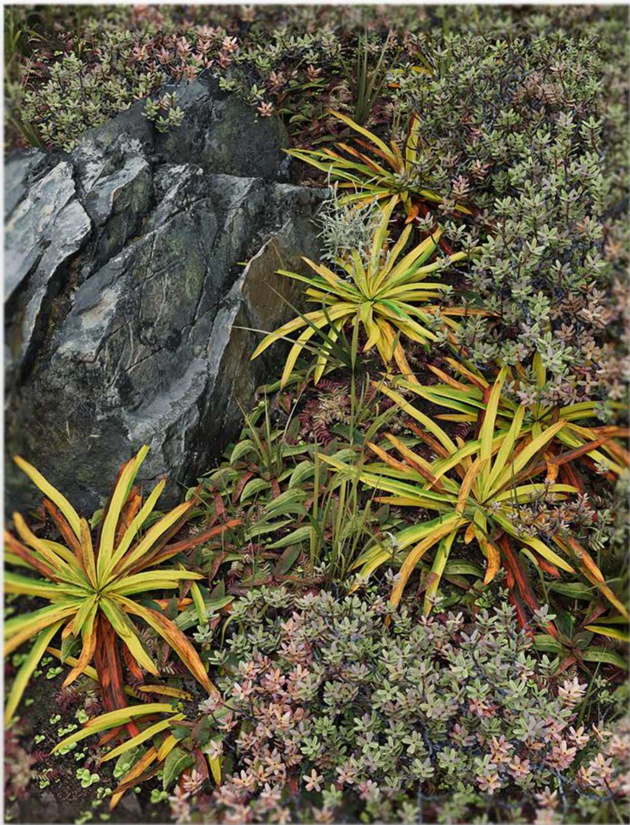
无题（遇到野猪之前）1 2024 铝、石膏打底、UV 打印 170×130×3.5cm