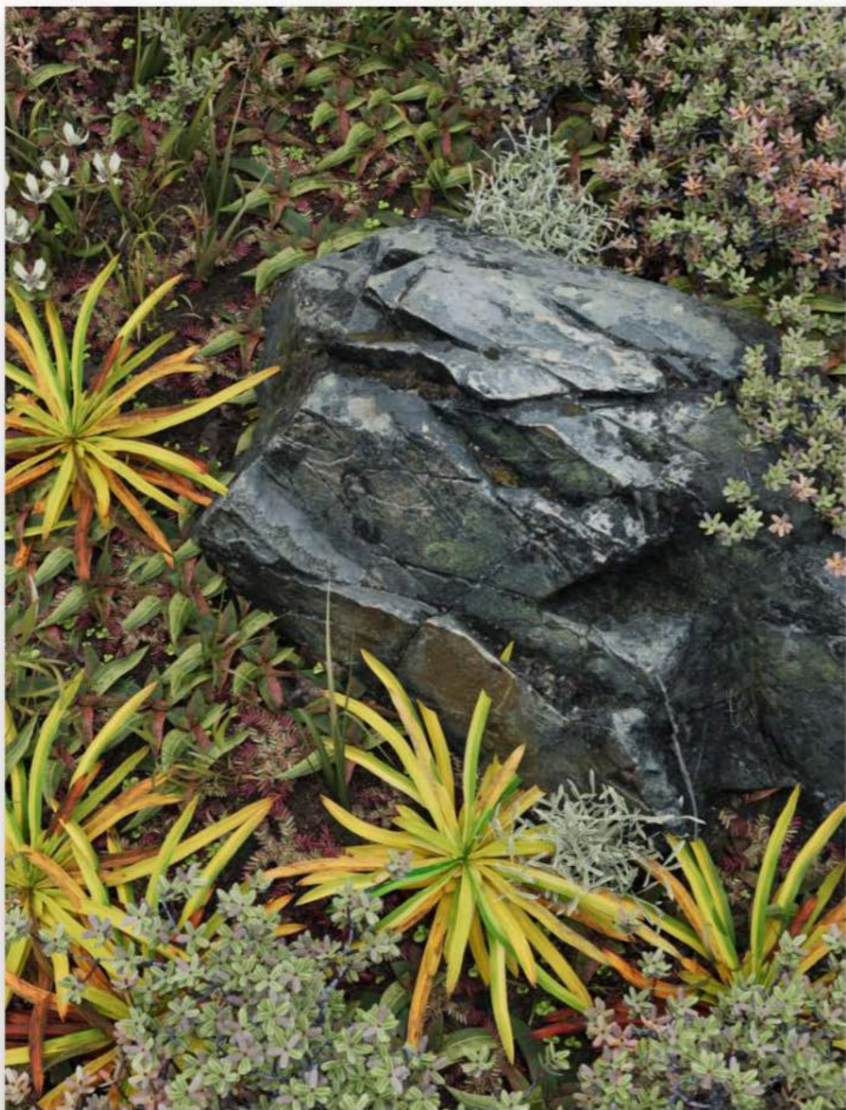
无题（遇到野猪之前）2 2024 铝、石膏打底、UV 打印 170×130×3.5cm