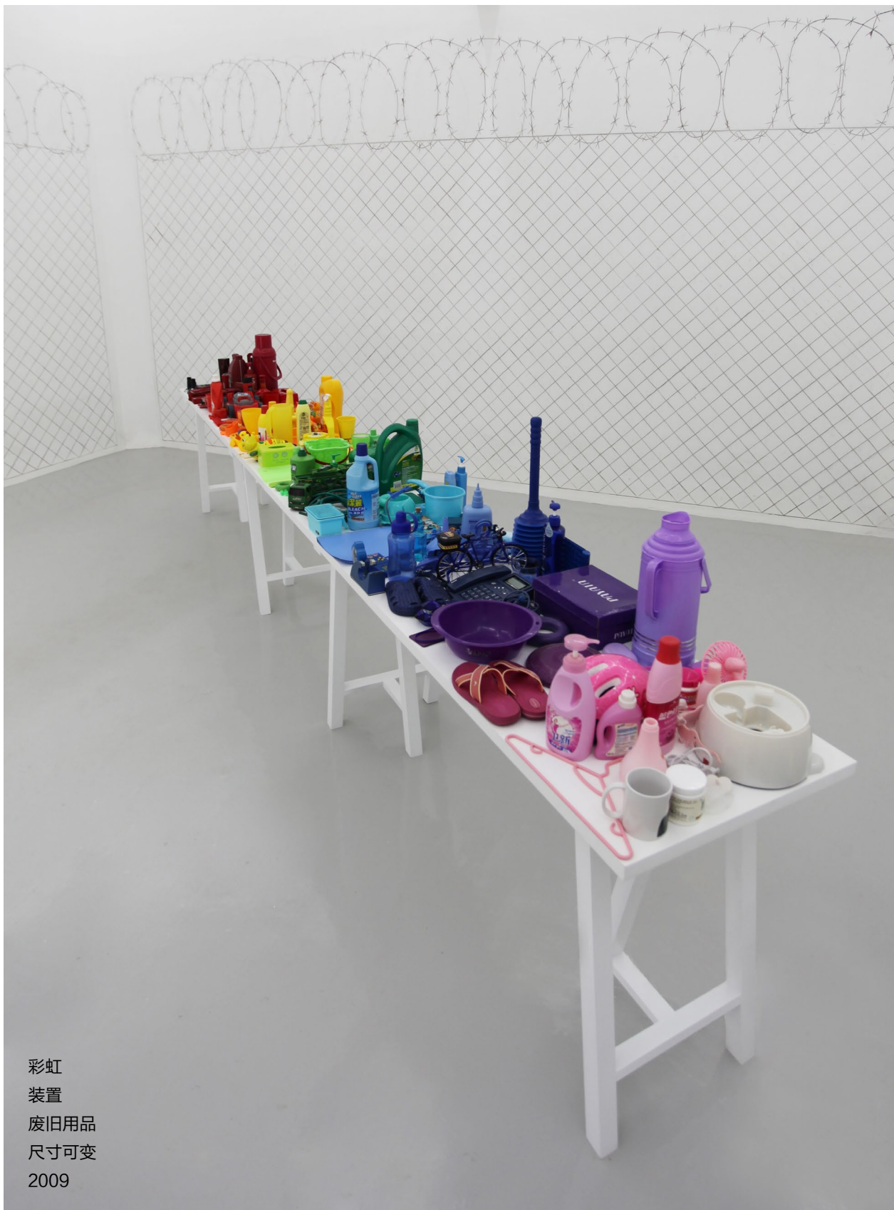
彩虹 装置 废旧用品 尺寸可变 2009