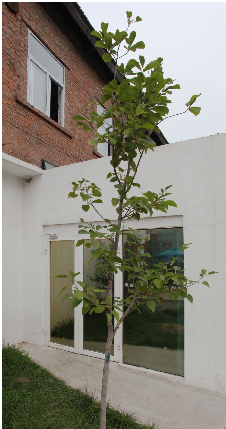
不要说出来 装置 树 2006

北京市朝阳区酒仙桥路2号798艺术区798东街 / 798 East Road, 798 Art District, No.2 Jiuxianqiao Road, Chaoyang District., Beijing, China T +86 10 5840 5117 / F +86 10 5978 9635 / E info@magician-space.com / W www.magician-space.com