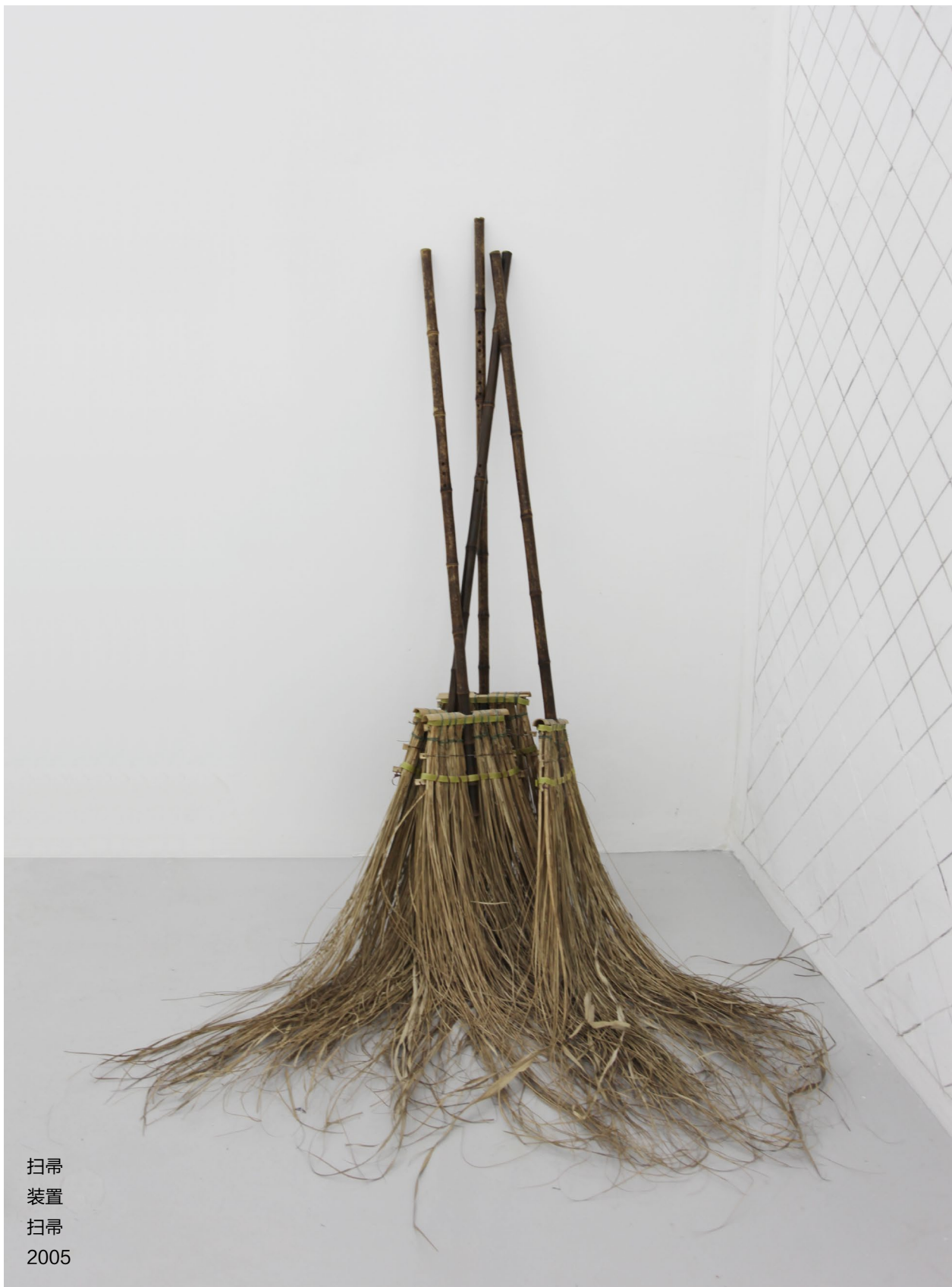
扫帚 装置 扫帚 2005

北京市朝阳区酒仙桥路2号798艺术区798东街 / 798 East Road, 798 Art District, No.2 Jiuxianqiao Road, Chaoyang District., Beijing, China T +86 10 5840 5117 / F +86 10 5978 9635 / E info@magician-space.com / W www.magician-space.com