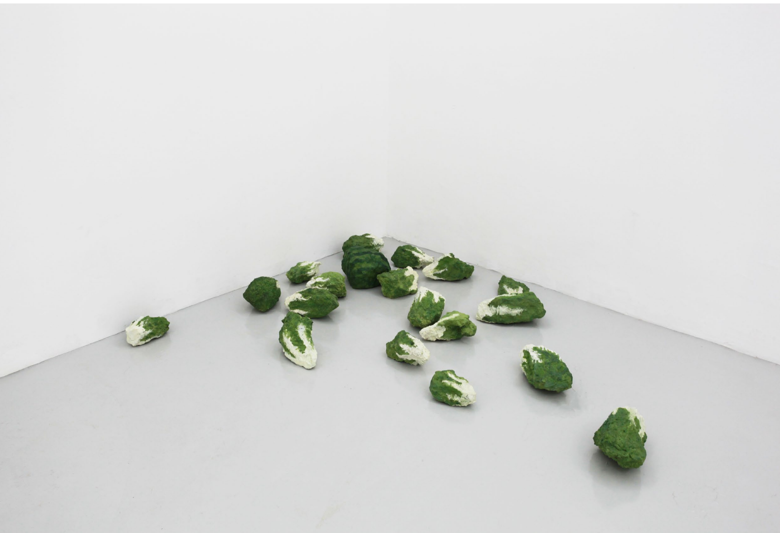
石尿 裝置 混凝土 2006

北京市朝阳区酒仙桥路2号798艺术区798东街 / 798 East Road, 798 Art District, No.2 Jiuxianqiao Road, Chaoyang District., Beijing, China T +86 10 5840 5117 / F +86 10 5978 9635 / E info@magician-space.com / W www.magician-space.com