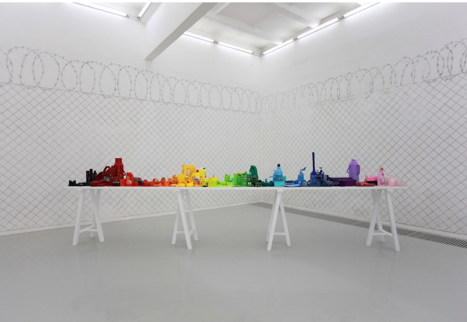
彩虹 装置 废旧用品 尺寸可变 2009

北京市朝阳区酒仙桥路2号798艺术区798东街 / 798 East Road, 798 Art District, No.2 Jiuxianqiao Road, Chaoyang District., Beijing, China T +86 10 5840 5117 / F +86 10 5978 9635 / E info@magician-space.com / W www.magician-space.com