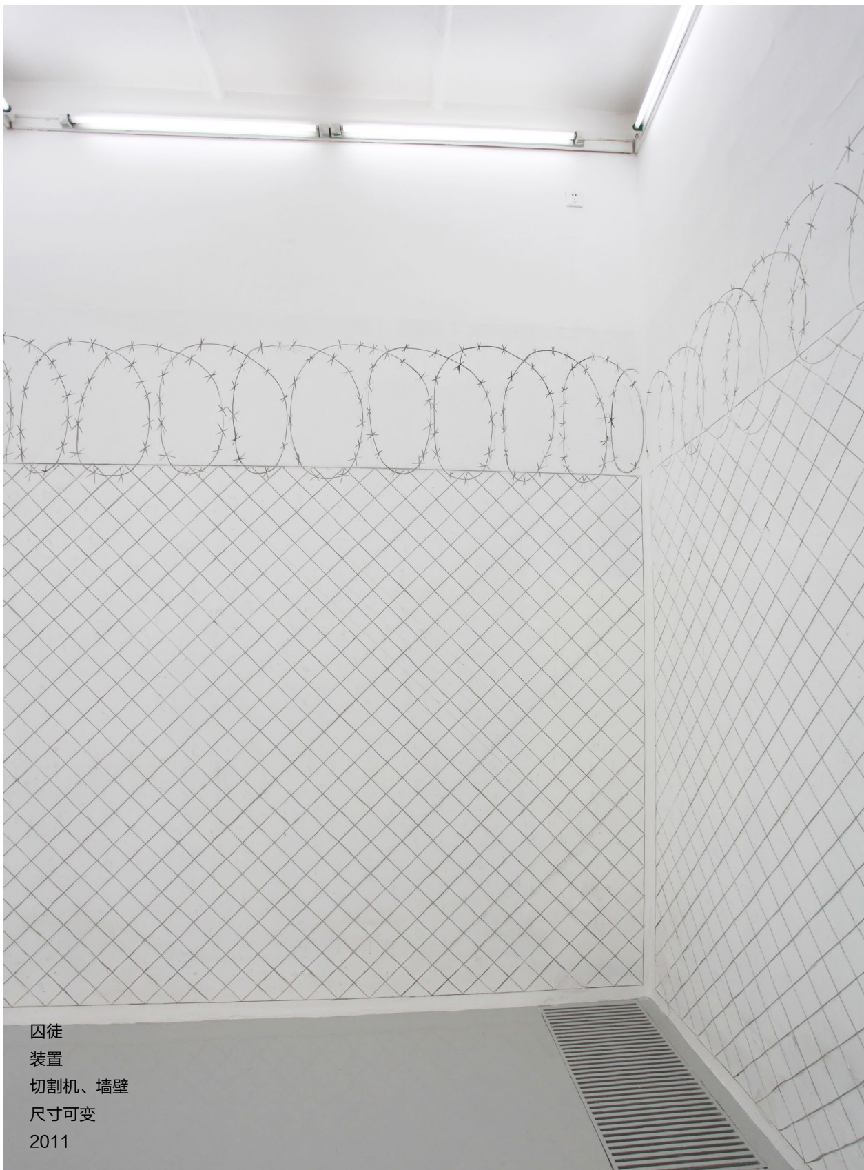
囚徒 装置 切割机、墙壁 尺寸可变 2011

北京市朝阳区酒仙桥路2号798艺术区798东街 / 798 East Road, 798 Art District, No.2 Jiuxianqiao Road, Chaoyang District., Beijing, China T +86 10 5840 5117 / F +86 10 5978 9635 / E info@magician-space.com / W www.magician-space.com