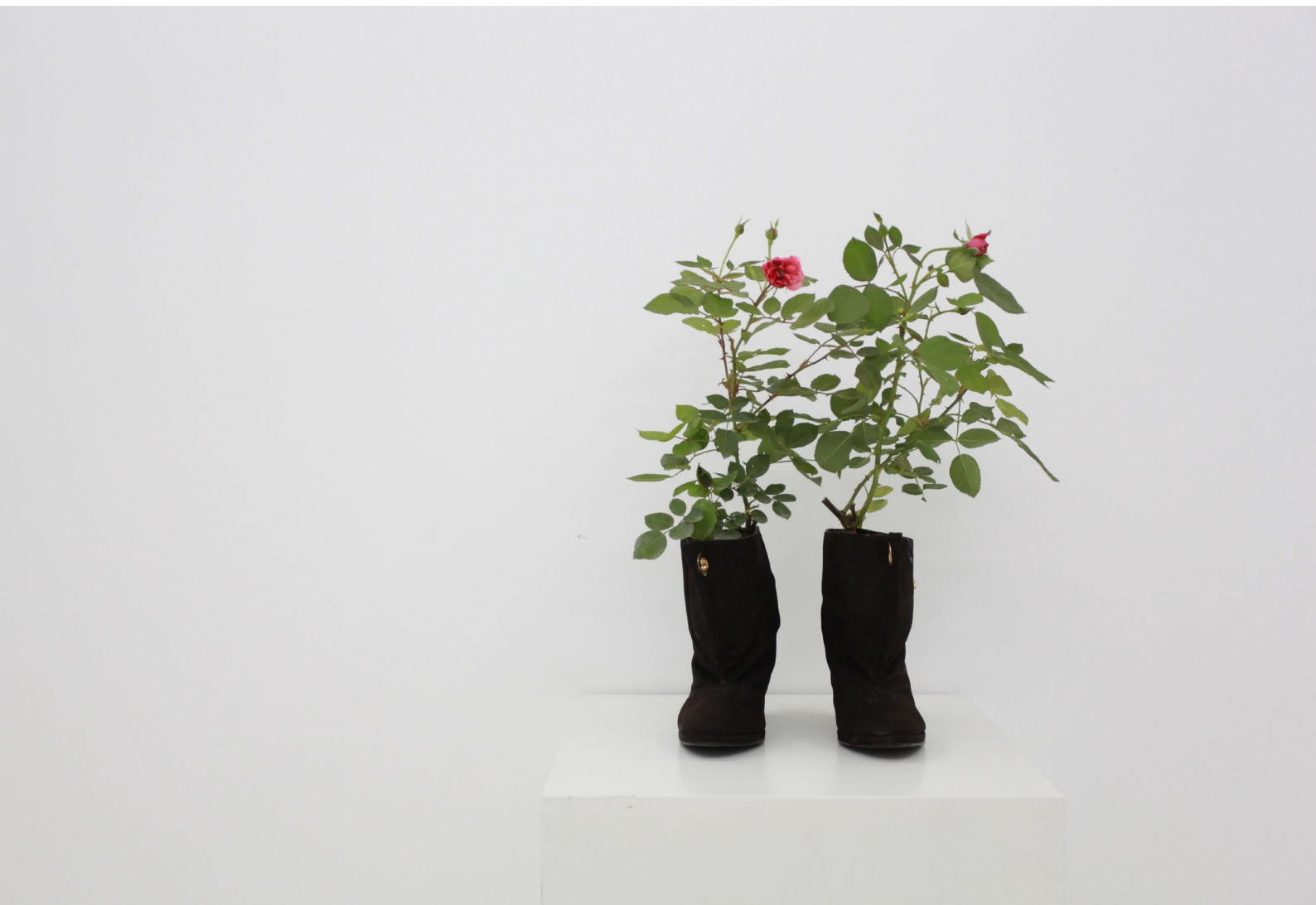
鲜花 装置 花卉、女式皮鞋 2005

北京市朝阳区酒仙桥路2号798艺术区798东街 / 798 East Road, 798 Art District, No.2 Jiuxianqiao Road, Chaoyang District., Beijing, China T +86 10 5840 5117 / F +86 10 5978 9635 / E info@magician-space.com / W www.magician-space.com