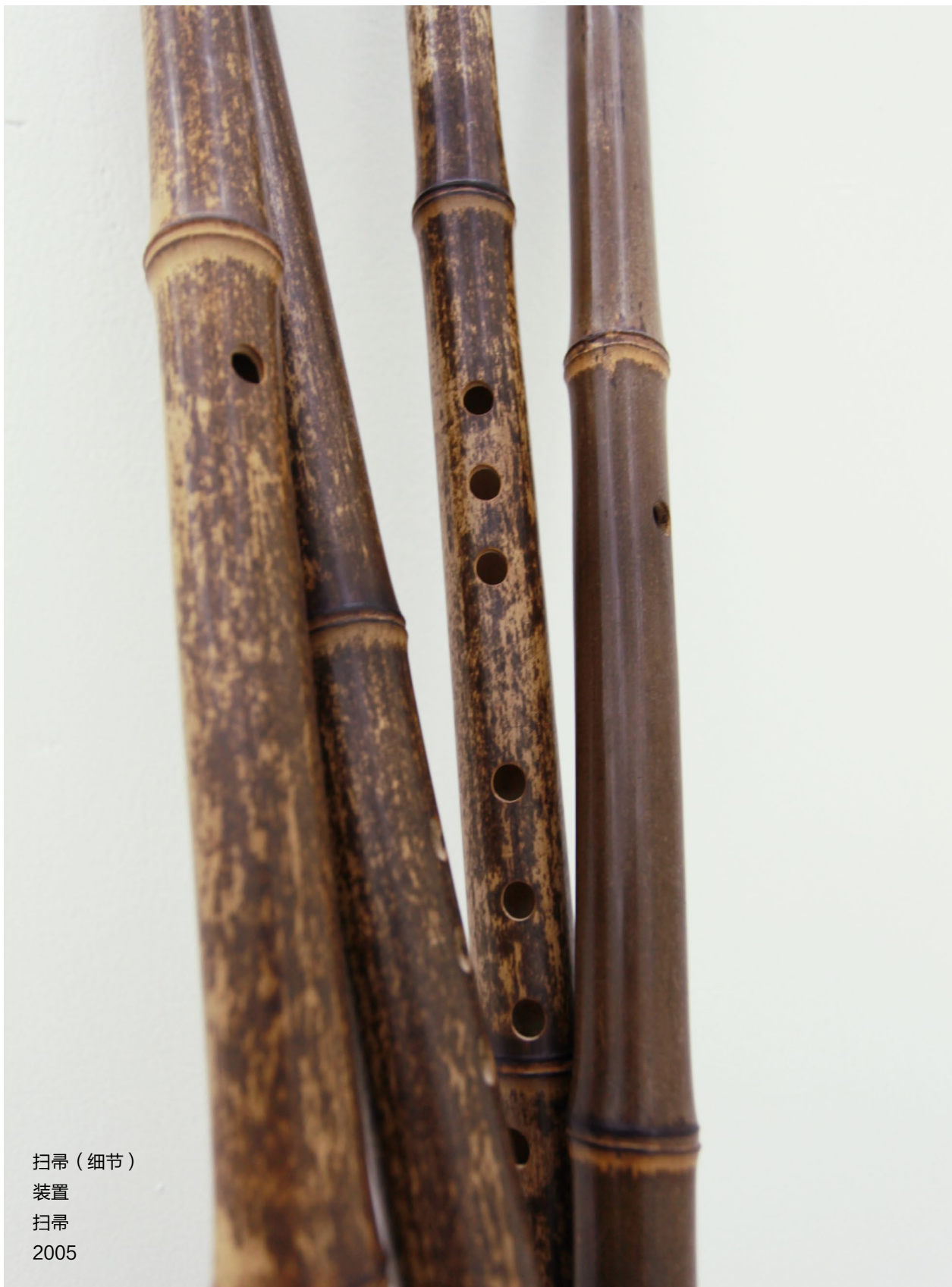
扫帚（细节） 装置 扫帚 2005

北京市朝阳区酒仙桥路2号798艺术区798东街 / 798 East Road, 798 Art District, No.2 Jiuxianqiao Road, Chaoyang District., Beijing, China T +86 10 5840 5117 / F +86 10 5978 9635 / E info@magician-space.com / W www.magician-space.com